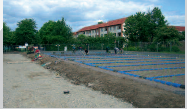
▲ Bvh. Naturfilteranlage Naturbad Grone, AG: Göttinger Sport und Freizeit GmbH