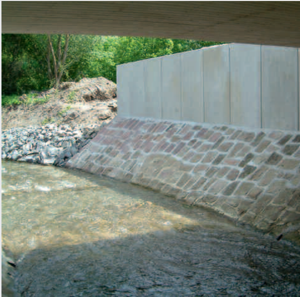
▲ Bvh. Brücke über die Rase in Rosdorf im Zuge des Neubaus der OU Rosdorf, AG: Gemeinde Rosdorf