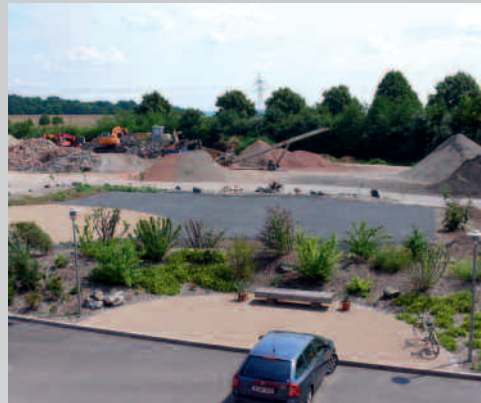
◀ Zur Erdwärmegewinnung wurden im Jahre 2008 1000 m Absorberleitungen aus Kunststoff vergraben und anschließend mit einer parkähnlichen Anlage begrünt.